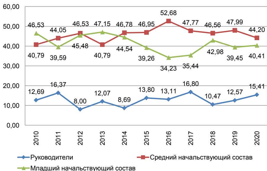
Рис. 3. Удельный вес совершенных преступлений по категориям сотрудников УИС в зависимости от общего числа преступлений в период 2010–2020 гг.

Общую характеристику совершенных пенитенциарных преступлений целесообразно рассматривать по группам: преступления, наиболее вероятные для совершения на территории учреждения; преступления, наименее вероятные для совершения на территории учреждения; преступления, невозможные для совершения на территории учреждения. Необходимо также учитывать факторы, при которых совершались преступления: непосредственно самими осужденными или сотрудниками либо с помощью третьих лиц. Указанная классификация позволит определить основные направления выработки мер по предупреждению данных преступлений и снижению их негативного воздействия.